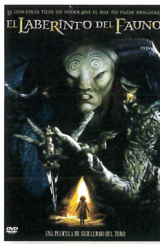
EL LABERINTO DEL FAUNO 2006

Argumento la historia se centra en Fausta, una joven que vive aterrorizada por el miedo de ser violada y que cree sufrir una enfermedad llamada "la teta asustada". Se trata de una extraña enfermedad que, a través de la leche materna, transmite de madres a hijos el miedo y el sufrimiento de mujeres que fueron violadas. Al morir su madre, desea enterrarla en su pueblo natal, pero no tiene dinero para ello.