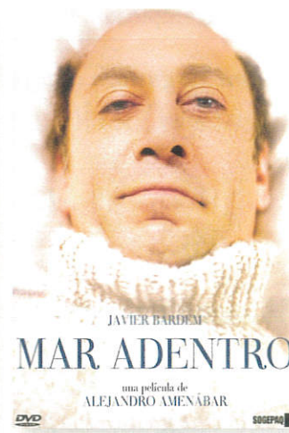
MAR ADETRON 2004

Argumento en 1944, tras la victoria del general Franco, una niña, Ofelia, y su madre, se trasladan a un pequeño pueblo en el que se encuentra Vidal, el nuevo marido de la madre, un cruel capitán del ejército franquista. Una noche, Ofelia descubre las ruinas de un laberinto y allí se encuentra con un fauno, una extraña criatura que le dice que ella es una princesa y que puede volver a su mundo mágico si pasa una serie de pruebas.