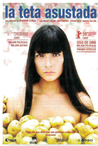
LA TETA ASUSTADA 2009

Argumento angustioso retrato de dos familias argentinas de la región de Salta, una de clase media urbana y otra de agricultores con dificultades económicas. Sus vidas se entrecruzan en el aburrimiento provinciano y el caos de una ciudad donde nada sucede, pero todo es tensión.