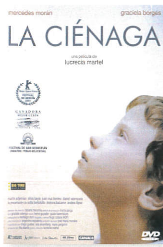
LA CIÉNAGA 2001

País Argentina Directora Lucrecia Martel Reparto Graciela Borges, Mercedes Morán, Martín Adjemian Género drama Tema la familia