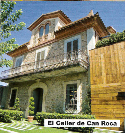
El Celler de Can Roca