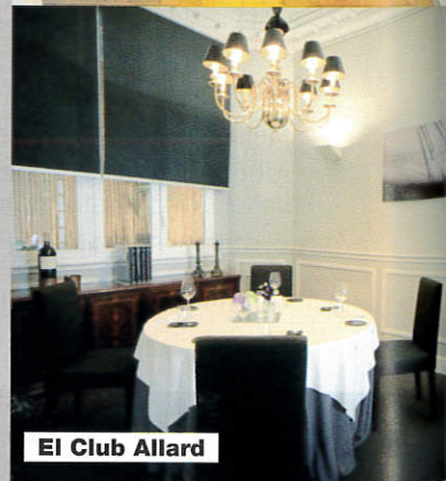
El Club Allard