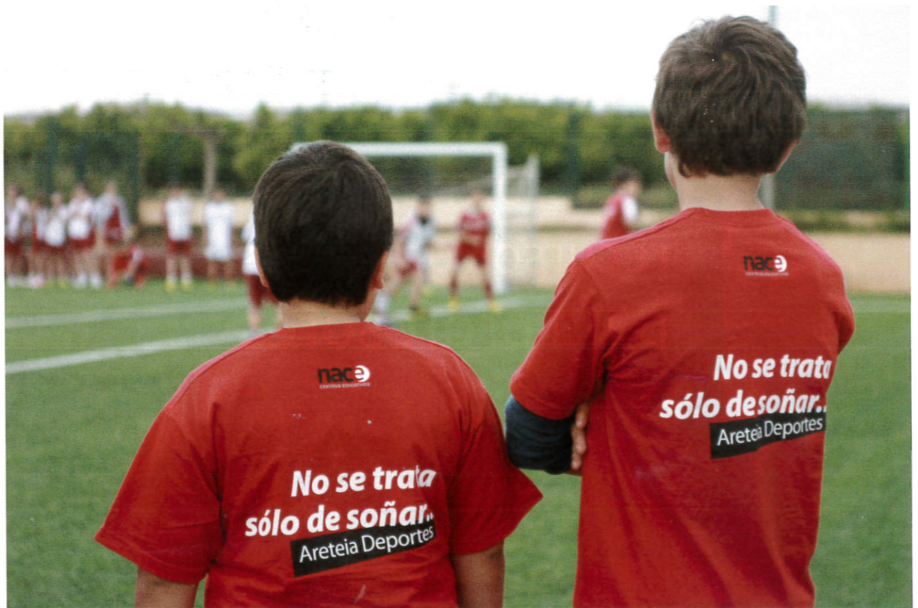
Alumnos del Colegio Areteia en Madrid