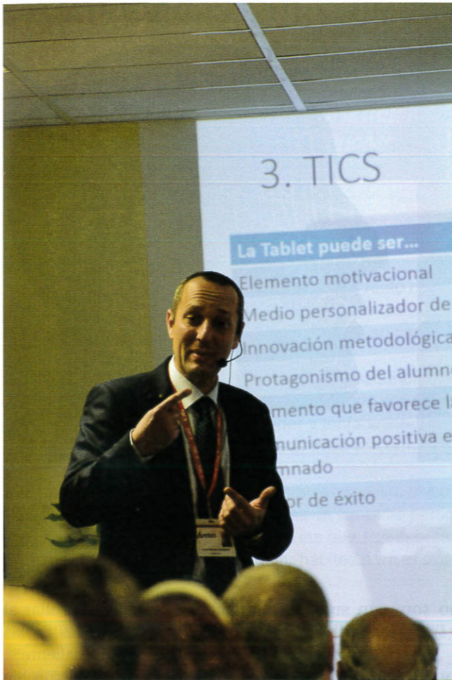
Las TIC son las siglas de Tecnologías de Información y de las Comunicaciones / Colegio Areteia

el tema de suspender 18 y ahí es cuando empecé a tener ansiedad y me sentía extraño en la clase, creía que no encajaba 19 bien. Incluso, en 2º de la ESO tuve problemas con chavales que se metían 20 conmigo...”.