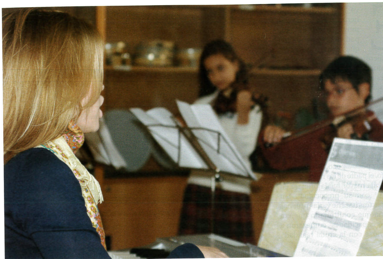
Alumnos del Colegio Areteia en Madrid

niños y que tienen las necesidades de cualquier niño pero que tienen además un potencial de aprendizaje