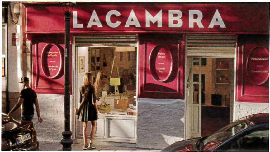
La tienda de Lacambra está en la calle Divino Pastor 16, de Madrid.

“Cuando monté Lacambra no tenía miedo. Ya había tenido una empresa antes y una res-