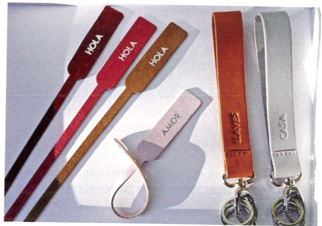
Imágenes del taller de Lacambra.

Estoy separada y estoy con mi hijo media semana y, las tardes que estoy con mi hijo, le recojo directamente del cole 19 y ya estoy con él, le llevo a actividades, a veces me lo traigo a la tienda, si tengo que hacer cosas... Tú eres un poco dueña de tu tiempo y a lo mejor él se acuesta a las nueve y media y yo me pongo a contestar emails”.