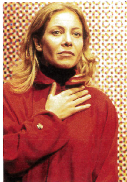
La actriz argentina Cecilia Roth pasó una larga temporada en España y trabajó con el director Pedro Almodóvar en Todo sobre mi madre . En enero de 2018 y gracias al movimiento #metoo, Cecilia Roth denunció en un programa de televisión de su país que un periodista español la había violado.

Un ejemplo de este ataque contra el fenómeno #metoo es el manifiesto firmado por cien artistas e intelectuales francesas en contra de dicho movimiento. En el texto