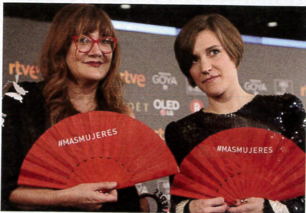
Las directoras de cine Isabel Coixet y Carla Simón