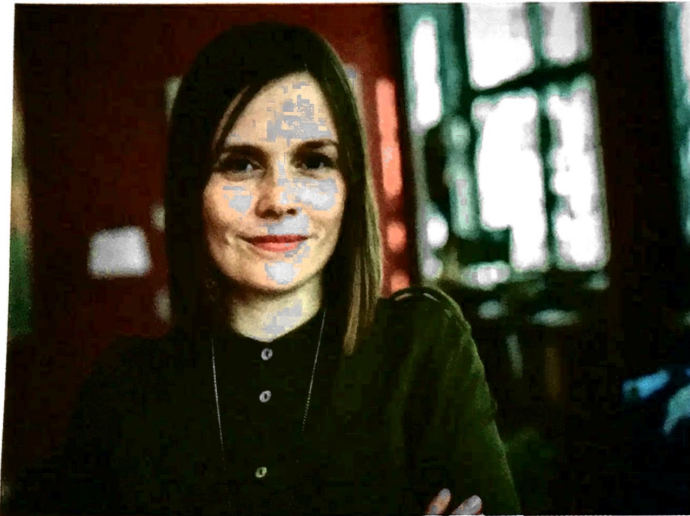
Katrin Jakobsdottir