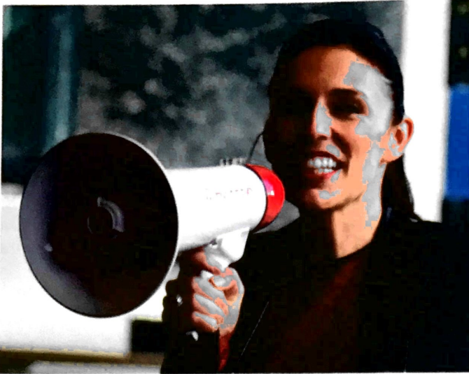
Jacinda Ardern / Ulysse Bellier