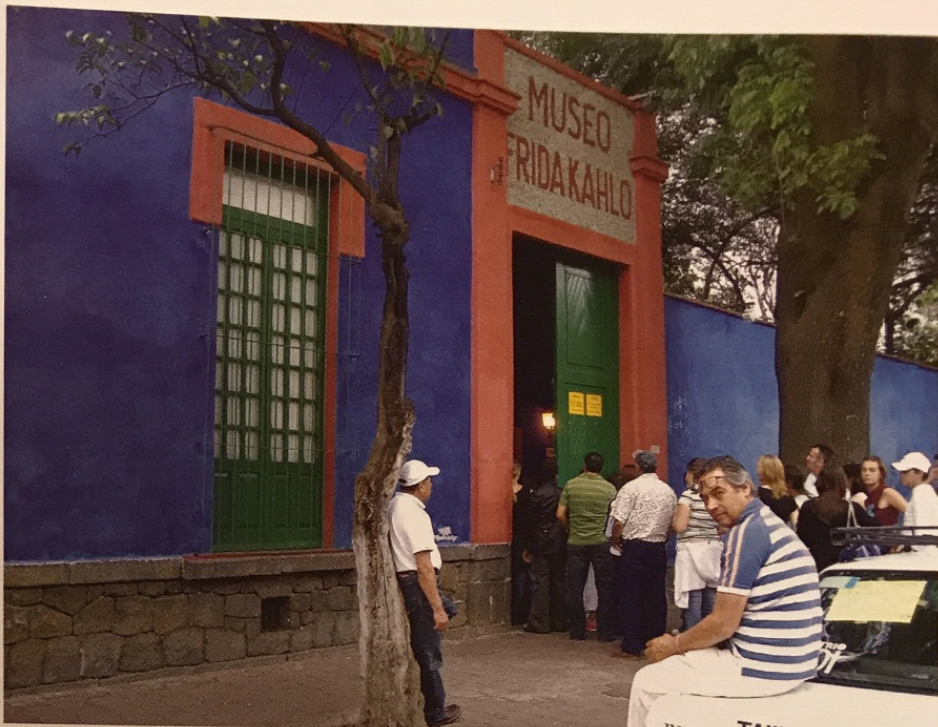
Casa Azul de Frida Kahlo en Coyoacán (Ciudad de México)

las dos variables: Frida tuvo un don 9 y, además, lo utilizó como arma de resiliencia contra el dolor. "Viva la vida", decía. Por eso, 110 años después de su nacimiento, el mundo entero sigue prestando atención a la obra de esta mexicana universal y a su intensa vida. A día de hoy, Frida Kahlo es uno de los iconos internacionales del arte, del feminismo y de la libertad.