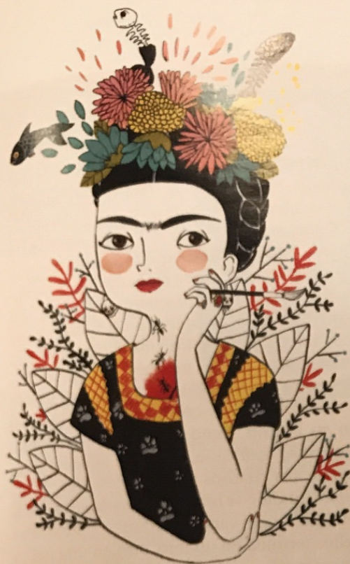
Retrato de Frida Kahlo