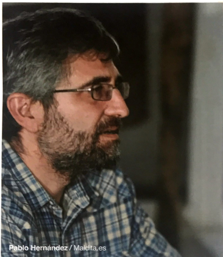
Pablo Hernández / Maldita.es

F CAMPAR A SUS ANCHAS No seguir las normas, hacer lo que uno quiere sin miedo a recibir un castigo.