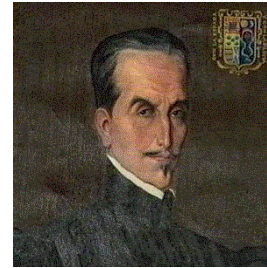
Garcilaso de la Vega

El hecho de regalar un libro está relacionado con Cervantes y Shakespeare. Estos soberbios escritores han pasado a la Historia por sus fabulosas obras, llegando a ser un símbolo importante en sus respectivos países. El mundo reconoce el trabajo de estos genios celebrando cada 23 de abril el Día del Libro. Así se hizo. De aquí la costumbre de regalar un libro. Además, esta jornada es muy apropiada para lanzar al mercado nuevas novelas, muchos autores la aprovechan y promocionan su último libro, y de paso quizás puedas conseguir un autógrafo de tu escritor favorito.