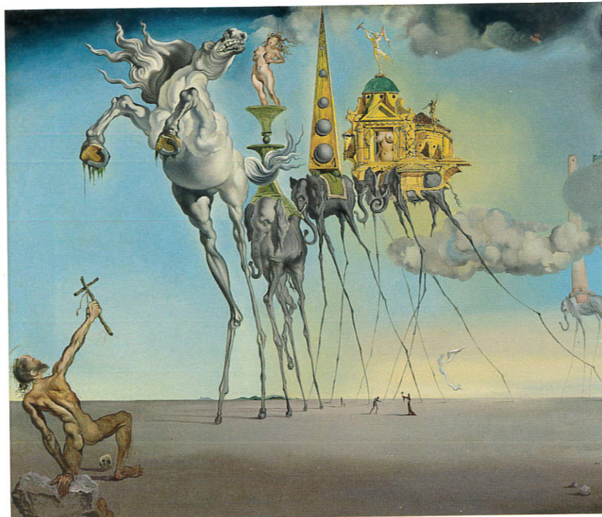
El espectro del sex-appeal (1934) y La tentación de San Antonio (1946) / © Salvador Dalí, Fundació Gala-Salvador Dalí, VEGAP

el surrealismo en el cine y rompiendo con todas las normas audiovisuales anteriores. En la exposición se puede leer la carta que Dalí dirigirá después a Buñuel, acusándole de abandonar las ideas creativas que compartieron en un pasado debido a la entrada del director aragonés en el Partido Comunista: "Es sorprendente cómo el hecho de entrar en tu partido anula todo vestigio 25 de inteligencia".